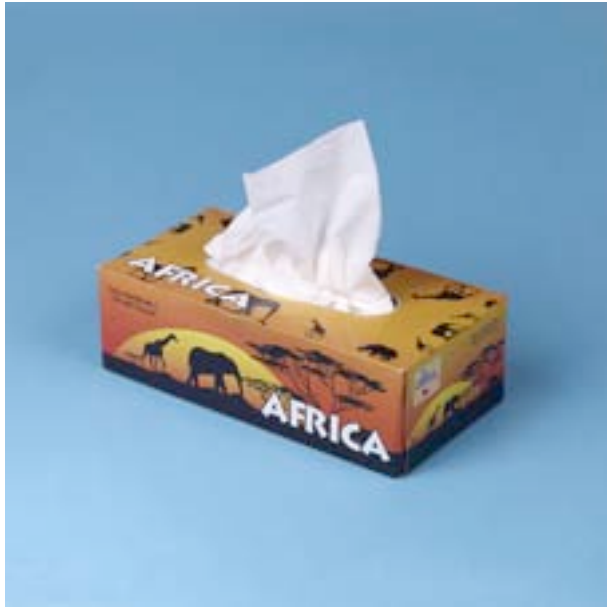
HJ_GIFTS AND TREASURES_002.JPG

Ich habe mich in meiner Abschlussarbeit LAST CHANCE JUNCTION mit einem westlichen Blick auf Afrika beschäftigt, die Herkunft und Veränderung dieses Blicks vom Kolonialismus bis heute betrachtet und mir die Frage gestellt, wie er Bildschaffende und Rezipienten beeinflusst. Was heißt das für mich als weißen, westlichen Fotografen, wenn ich in einem afrikanischen Land arbeiten möchte? Wie verändert sich meine gesellschaftliche Position und wie wirkt sich diese Veränderung auf meine künstlerische Position aus?