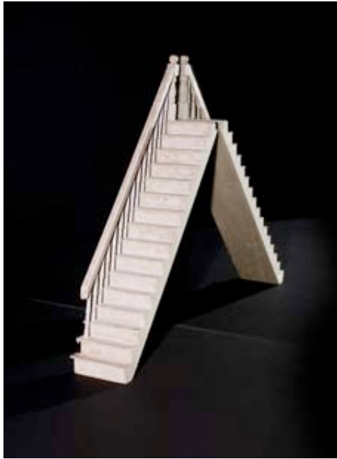
AH_Bild_018.jpg