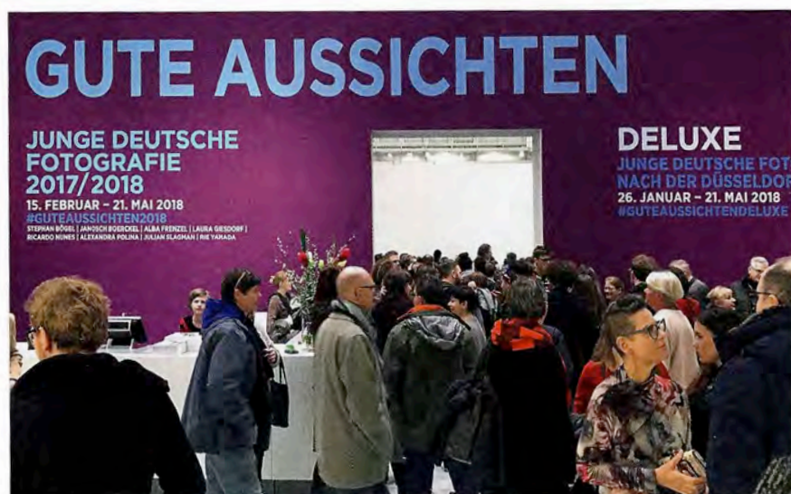
Haus der Photographie, Deichtorhallen Hamburg 2018, Eröffnung gute aussichten deluxe