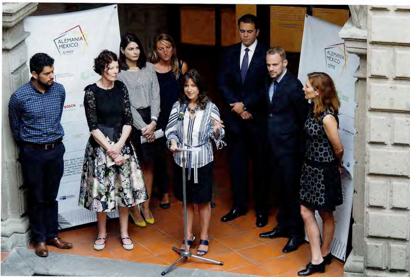
gute aussichten deluxe , Museo de la Cancillería Mexiko City

Mexiko–Deutschland definiert, unter deren Dach ein ‚gemischtes Doppel‘ ein dialogisches Werk erarbeitet. Zum Auftakt treffen sich die mexikanischen und deutschen Teilnehmer:innen in Mexiko City, reisen weiter nach Oaxaca, wo ihnen die ‚Casa Cultural de San Agustín‘ Unterkunft und Räume gewährt. Bis Ende Oktober 2023 müssen alle Werke fertiggestellt und produziert sein. Ein deutsch-mexikanisches Kuratoren-Team konzipiert die Ausstellung, die am 7. Dezember im Centro de la Imagen in Mexiko City eröffnet und dort bis zum 19. März 2024 zu