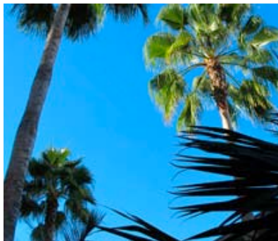
Der Himmel im November über Los Angeles und die ...