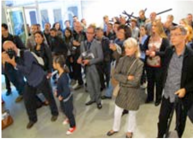
Eröffnung von OBLICK 2012 in La Chambre, Strasbourg