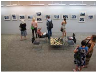
... in der Skokie Public Library

the 9 "gute aussichten" Award Winners. Invitation to the Exhibition (PDF) at the End of this Site. Closed. More Infos asap.