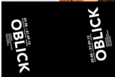
... und die Einladungskarte zu OBLICK 2012

Öffnungszeiten: Nur auf Anmeldung, telefonisch oder via e-mail: info(at)guteaussichten.org . Opening hours: Only by Request, please phone or e-mail: info(at)guteaussichten.org .