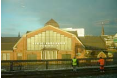
Der Himmel im Januar über Hamburg ...