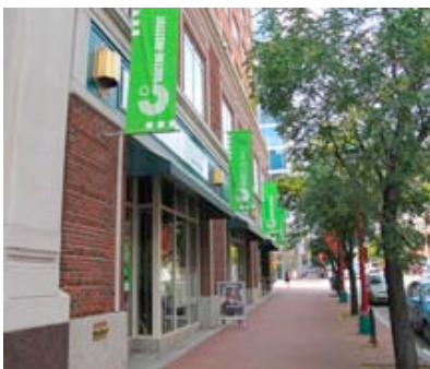
... im Goethe Institut Washington DC

Verkehrsmittel: Alle U-/S-Bahnen und Busse, die am HBF Hamburg halten. Local Traffic: All Metro-Lines and Busses Stop Hamburg Central Station.