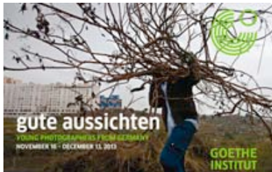
... Einladungskarte zur Ausstellung