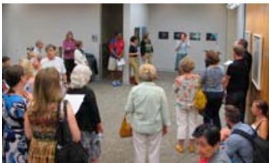
Eröffnung von gute aussichten im Herbst 2013 erstmals in Chicago ...

Ab dem Jahr 2014 gibt es für alle "gute aussichten" Preisträger/innen noch einen zusätzlichen Mehrwert: OBLICK. Das Dreiländer-Fotografie-Festival (Frankreich, Schweiz und Deutschland) wird verantwortlich von unserem französischen Kooperationspartner in Strasbourg, La Chambre, getragen. Alle, die bei "gute aussichten" gewinnen, nehmen automatisch an der Auswahl für den OBLICK-Preis teil. Am Ende wird OBLICK je drei Arbeiten aus Deutschland, Frankreich und Schweiz in Strasbourg präsentieren. Weitere Infos unter www.oblick.org .