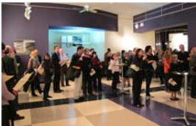
Eröffnung der Ausstellung in 2013 ...