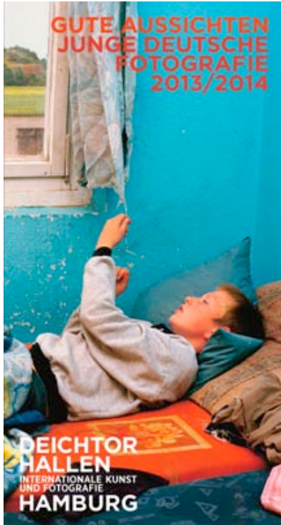
Der Norden ruft: Das Motiv der Einladungskarte für Hamburg