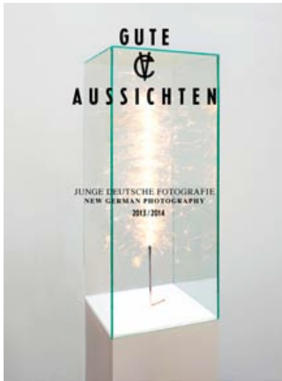
Cover des gute aussichten 2013/2014 - Specials mit einer Abbildung aus Alwin Lays Arbeit "mod. CLASSIC"

Closed. Gossip, Photos, Reviews from the Viewer and Participants asap.