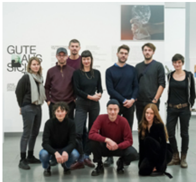
Die 10 Preisträger*innen im November 2019 im NRW-Forum Düsseldorf

Bitte beachten Sie die aktuell vorgeschriebenen Hygiene- und Sicherheitsregeln für Ihren Besuch in den Deichtorhallen, die Sie hier finden.