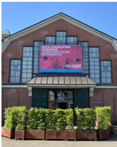
Offen und bis 30. August 2020 in den Deichtorhallen Hamburg gute ...