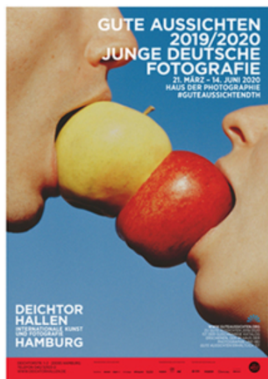
... aussichten 2019/2020 & GRANT III

Ausführliche Informationen zu den Preisträger*innen und ihren Arbeiten finden Sie hier (Top Ten).