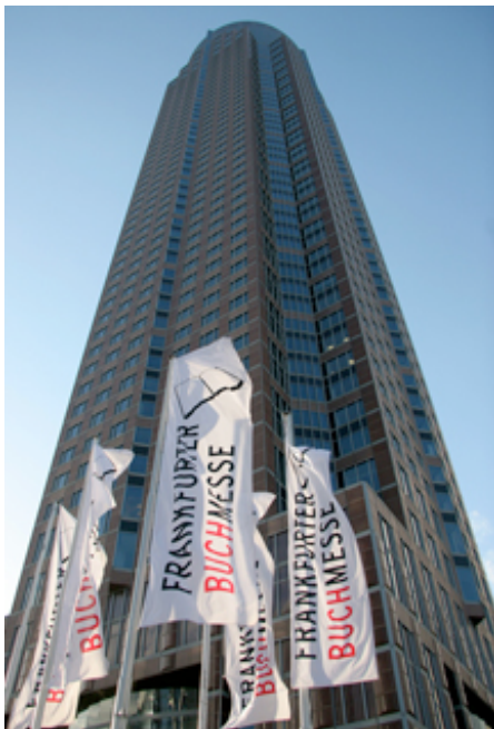
Frankfurter Buchmesse, 14.-18.10.2009, mit "gute aussichten"-Fotostudio in Halle 8.0 M 984

➔ AKTUELL ARCHIV PRESSEKIT PRESSESPIEGEL KONTAKT