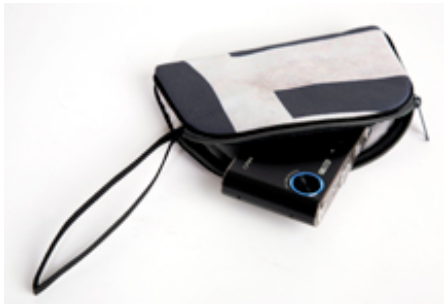
"klicki", das erste Softbagchen der Welt, handgenäht aus dem "gute aussichten" Ausstellungsbanner von Berlin...

➔ AKTUELL ARCHIV PRESSEKIT PRESSESPIEGEL KONTAKT