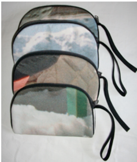
... jedes Exemplar ein Unikat, gefüttert, samtweich, mit Reissverschluss ...